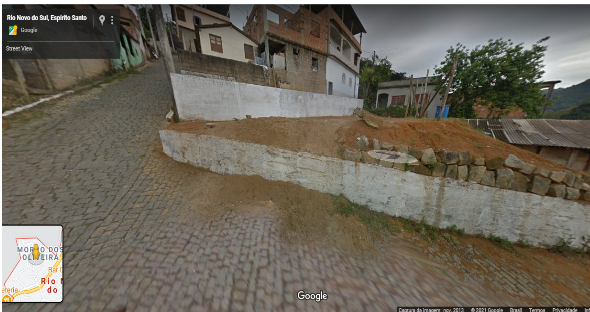
Rua Antônio Brandão - Casa Construída nesse Terreno - Nº 07 Casa limite - Família de Dalila Vicente.

Observação: A última casa - Nº 08 Casa limite - Família de Orlandino Biella, não tem visualização por não constar no mapa oferecido pelo site Google Maps.